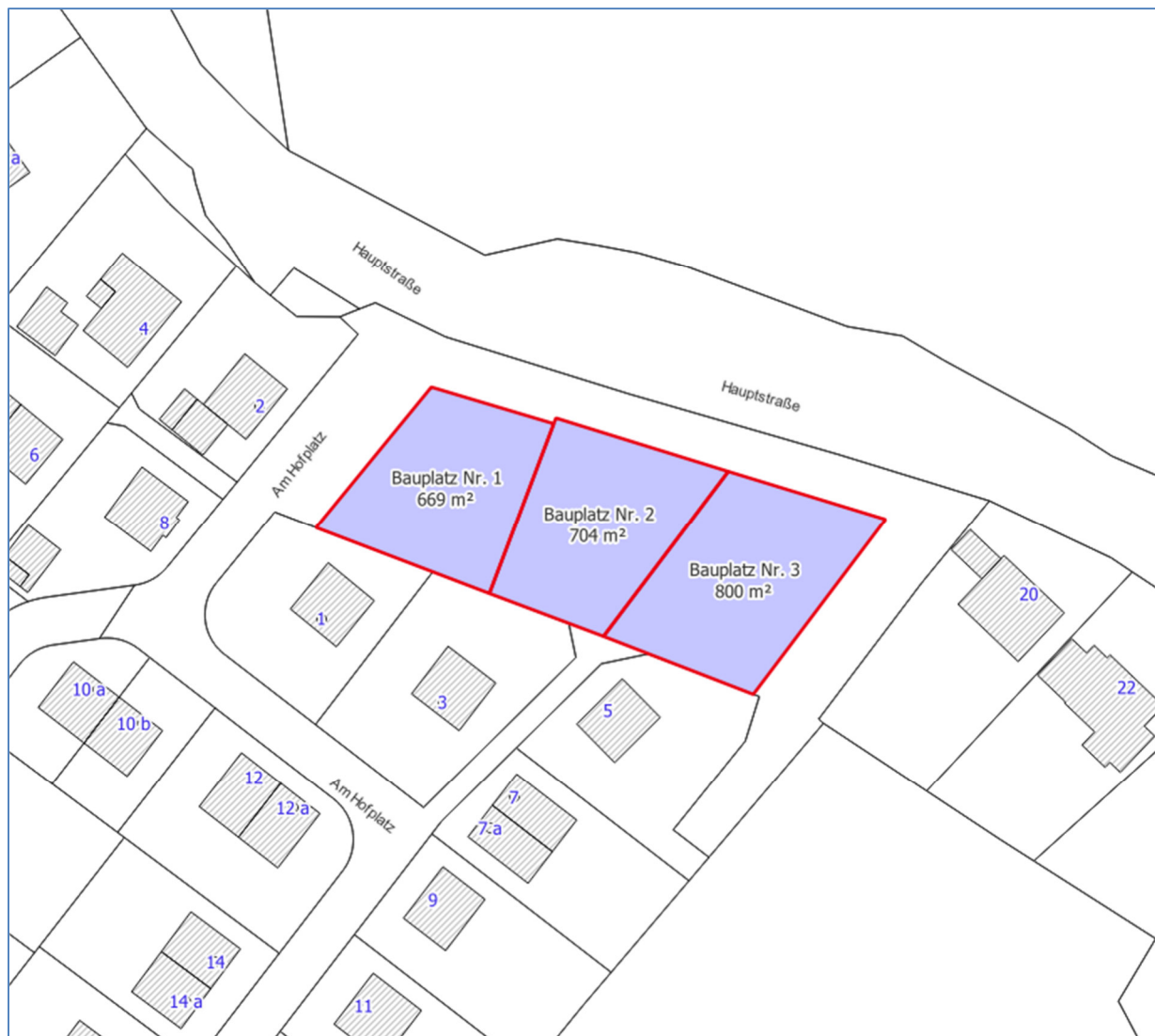
Bauplatzübersicht B-Plan Nr. 10 – 2. Änderung Todendorf (Am Hofplatz)

Die Gemeinde Todendorf veräußert kurzfristig 3 Bauplätze im Baugelbiet „Am Hofplatz“.